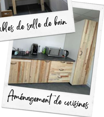
Aménagement de cuisines