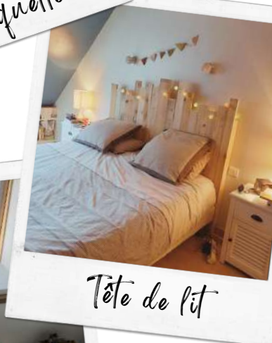
Tête de lit