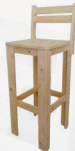
CHAISE DE BAR