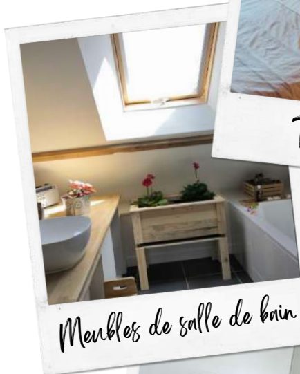
Meubles de salle de bain