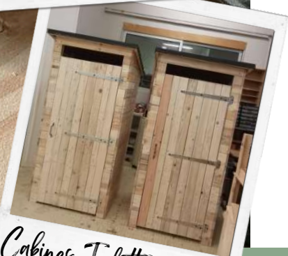
Cabines Toilettes sèches