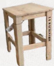
TABOURET BAS BOIS BRUT