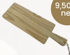
PLANCHE APÉRITIVE RECTANGLE BOIS BRUT