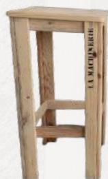
TABOURET HAUT BOIS BRUT