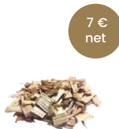
SAC COPEAUX 10 KG RÉF 107001